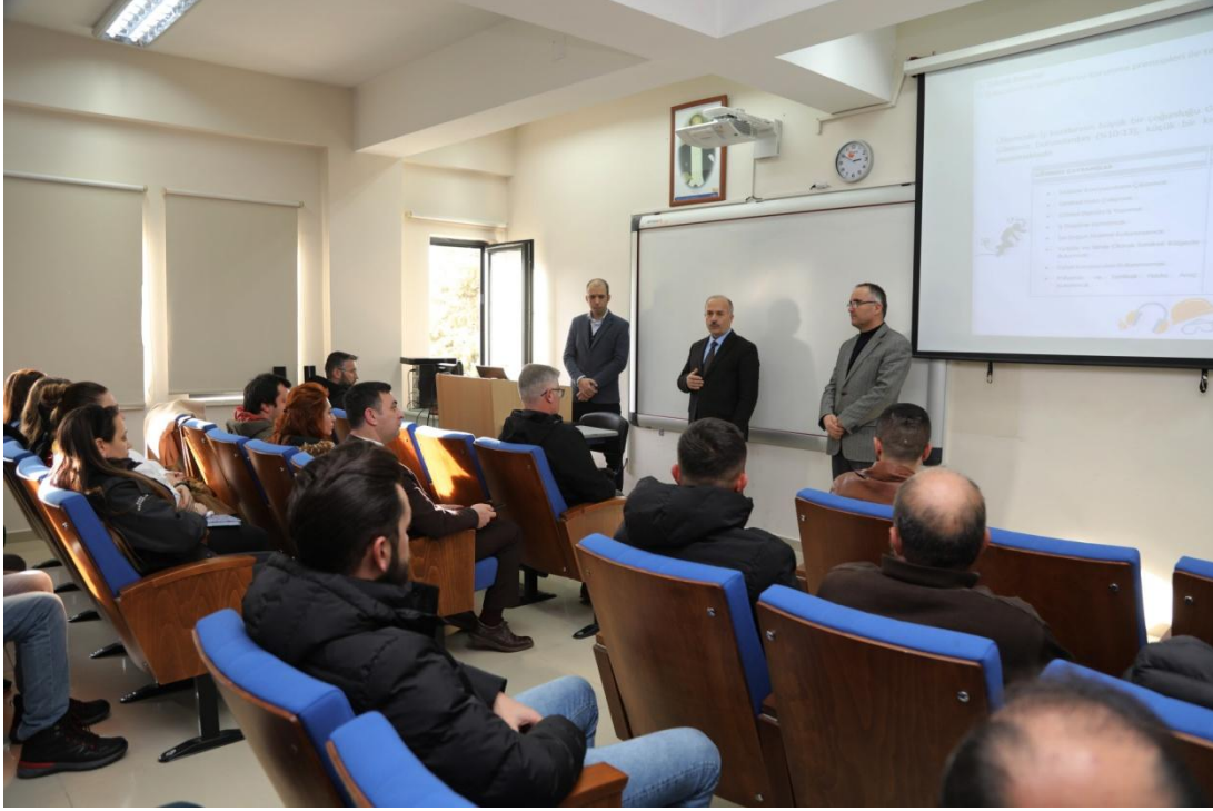
Şekil 8. Temel İSG Eğitimi

Trabzon Üniversitesi Sürekli Eğitim Merkezi tarafından organize edilen üniversite personelimiz için Temel İSG Eğitimi koordinatörlüğümüzce verildi. Eğitim ile ilgili görsel Şekil 8’de gösterilmiştir.