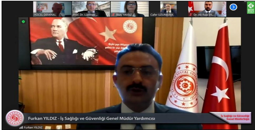
Şekil 5. Üniversitelerde İSG Uygulamaları Çevrimiçi Paneli

Çalışma ve Sosyal Güvenlik Bakanlığı İSG Genel Müdürlüğü tarafından düzenlenen Üniversitelerde İSG Uygulamaları Çevrimiçi Paneline üniversitemiz adına katılım sağlanmıştır. Üniversitelerin hiyerarşik ve çalışma yapıları, üniversitelerde İSG organizasyonunun nasıl oluşturulacağı ve güvenlik kültürü hakkındaki görüşler paylaşıldı ve bilgilendirme yapıldı. Etkinlik ile ilgili görsel Şekil 5'te paylaşılmıştır.