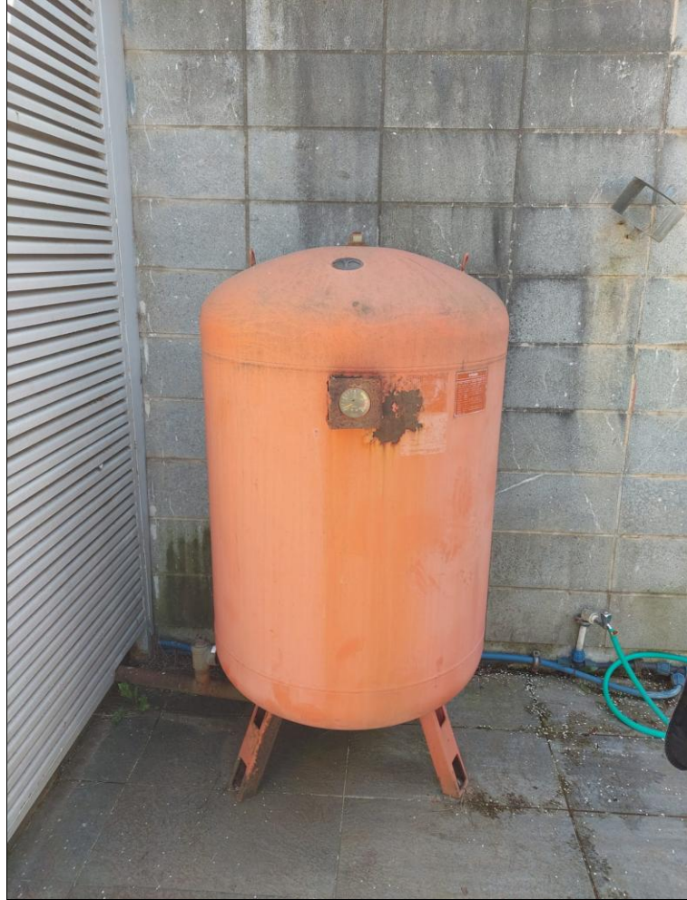
Őekil 2. İlahiyat Fak6ltesi Saha Ziyareti

6niversitemiz b6nyesinde yer alan eęitim birimlerinin iŐ güvenlięi aısından fiziki durumlarını g6rmek adına İlahiyat Fak6ltesi, Tonya MYO, Őalpazarı MYO ve BeŐikd6z6 MYO saha ziyaretleri yapılmıŐtır. Saha ziyaretleri ile ilgili g6rseller Őekil 2, Őekil 3 ve Őekil 4'te g6sterilmiŐtir.