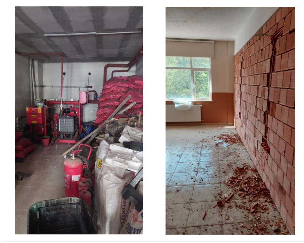
Şekil 3. Şalpazarı MYO Saha Ziyareti