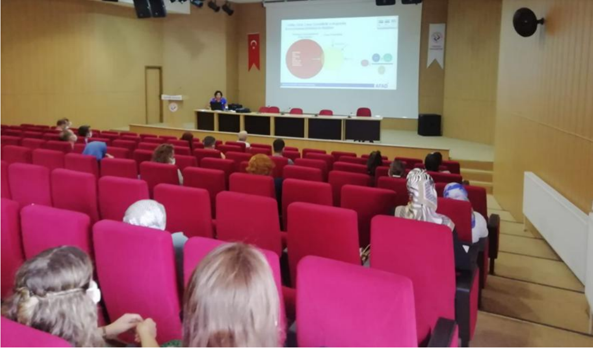
Şekil 6. Afet Farkındalık Eğitimci Eğitimi

Trabzon AFAD Müdürlüğü'nün düzenlediği Afet Farkındalık Eğitimci Eğitimine üniversitemiz adına katılım sağlanmıştır. İlgili görsel Şekil 6'da gösterilmiştir.